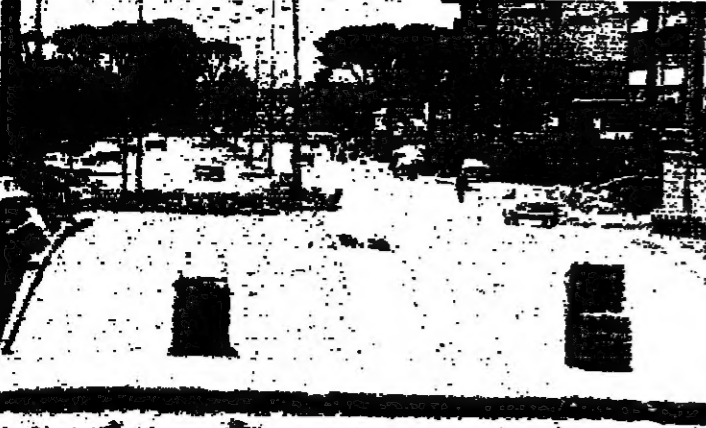
طريق حصص شتيل